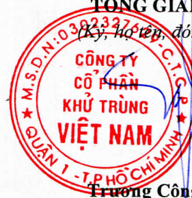
Trương Công Cứ