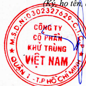
Trương Công Cứ