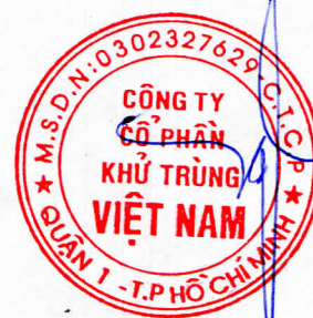
Trương Công Cứ